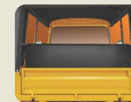
अतिरिक्त लगेज स्थान