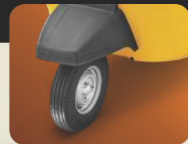
3 व्हीलर सेगमेंट में पहली बार ट्यूबलेस टायर्स