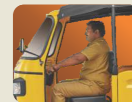
बड़ा ड्राइवर केबिन