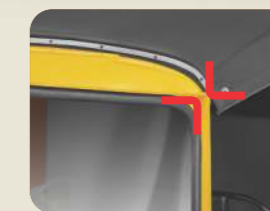
लाजवाब बिल्ड क्वालिटी